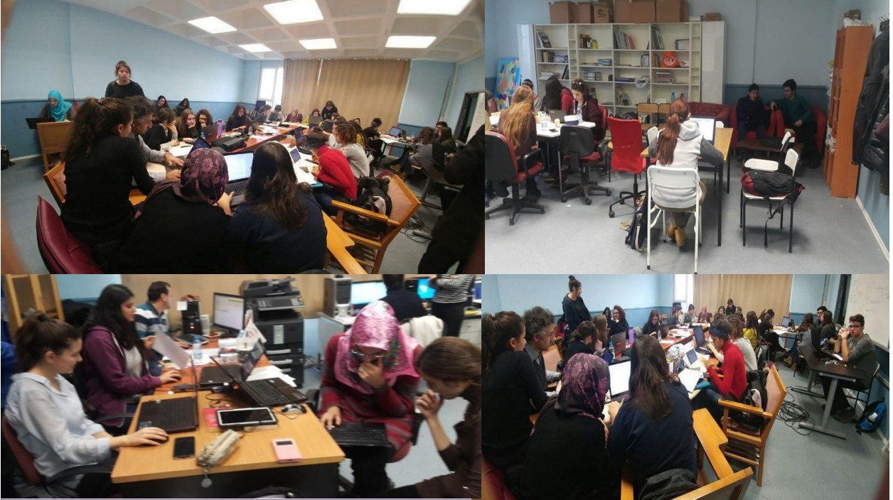
Proje grubumuzun çalışmaları