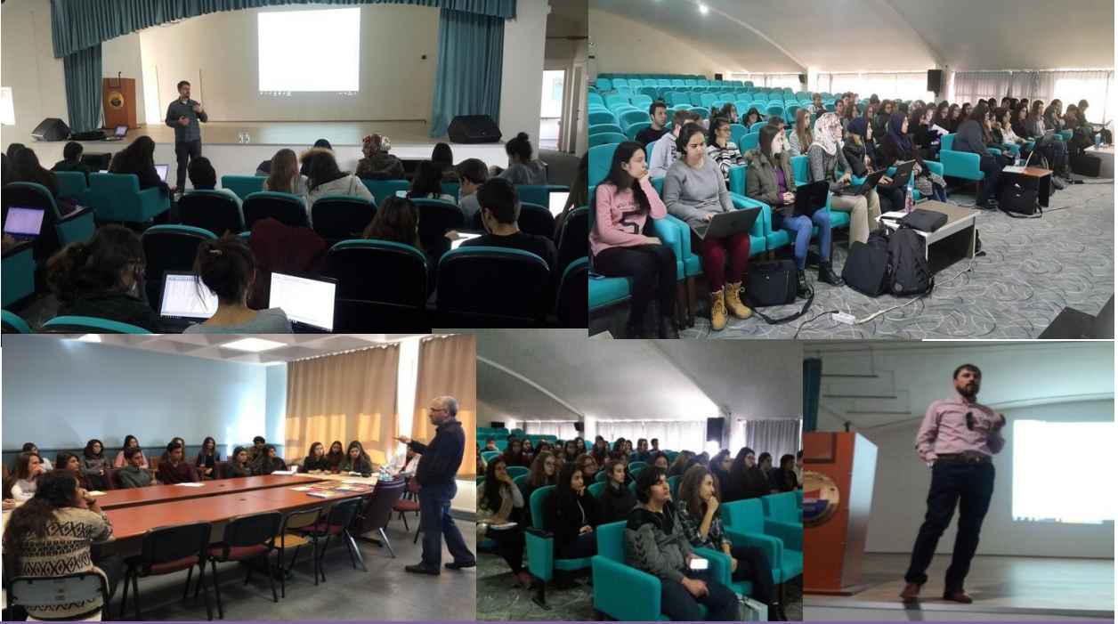
Proje grubumuzun aldığı eğitimler.