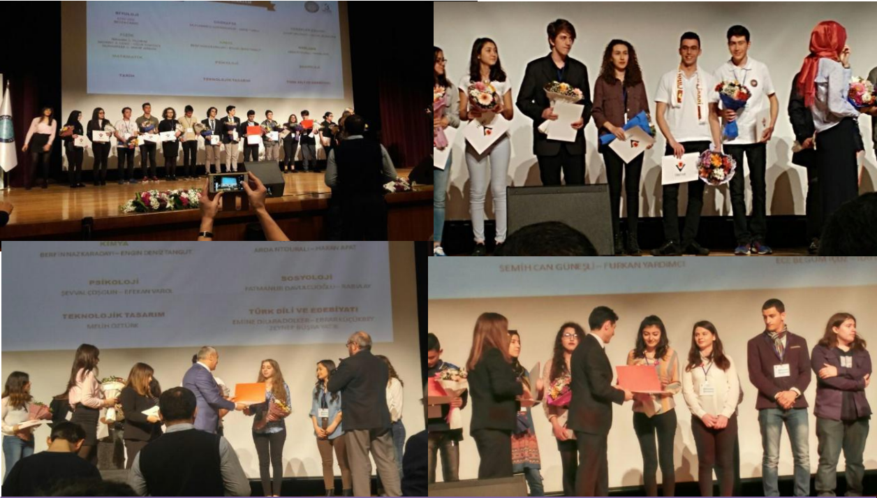
TÜBİTAK Lise öğrencileri araştırma projeleri yarışması bölge finaline 17 projeye katılan öğrencilerimiz 6 dalda 4 Birincili, 4 İkincilik ve 3 Üçüncülük olmak üzere toplamda 11 ödül aldılar. Türkiye Finalinde ise Değerler Eğitimi alanında öğrencilerimiz Türkiye üçüncüsü olmuşlardır.