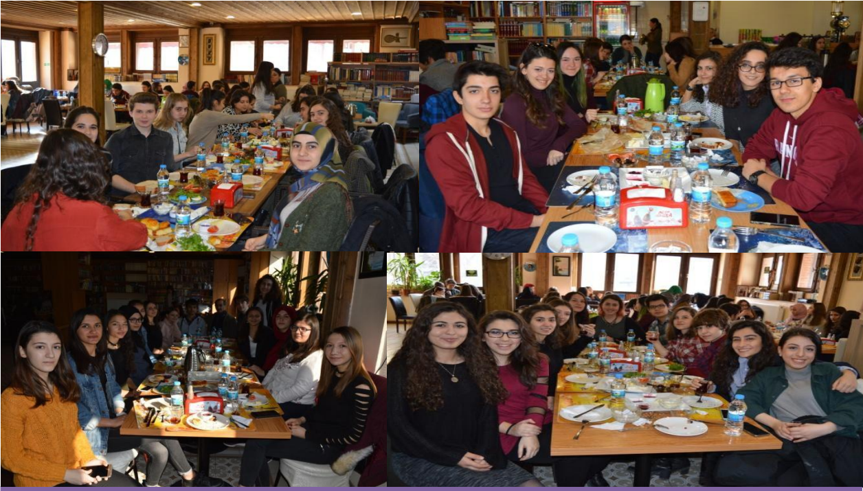
Projelerini tamamlayan öğrencilerimiz tarihi bir mekanda kahvaltı yaptılar.